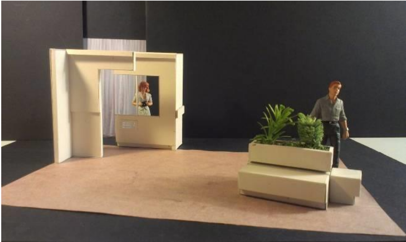
Lino, voileage, banquette et châssis à géométries variables.